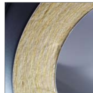
Højeffektiv isolering sikrer hurtig opvarmning og gode trækforhold