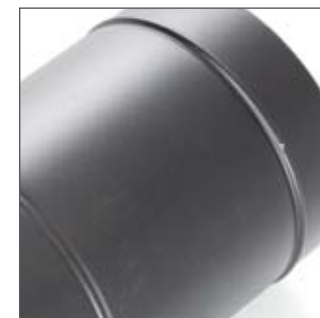
Kraftig lakering sikrer udseendet mange år frem