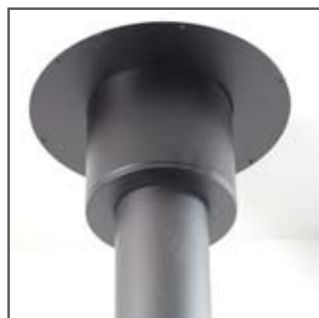
Stilrent design uden synlige overgange