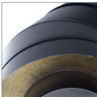
60 mm overlap sikrer en stabil og vandtæt skorsten